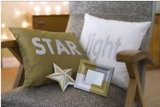
Posca voor alle ondergronden

Een assortiment van balpennen met gel-inkt voor een waaier van pastel-, metaal- en glittereffecten.