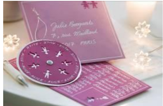
Uni-Ball – Feestelijke inkt